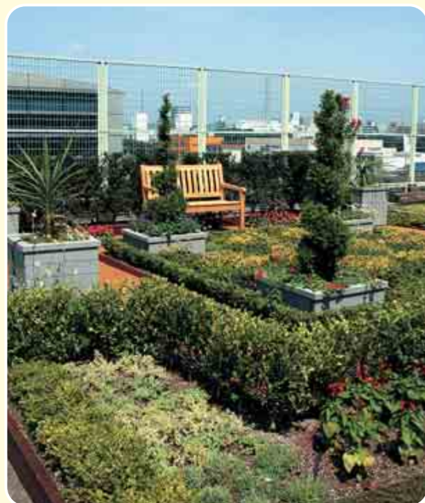
屋上緑化実験・見本園

平日の午前8時30分～午後5時まで 休園日は国民の祝祭日・土・日曜日。年末年始です。