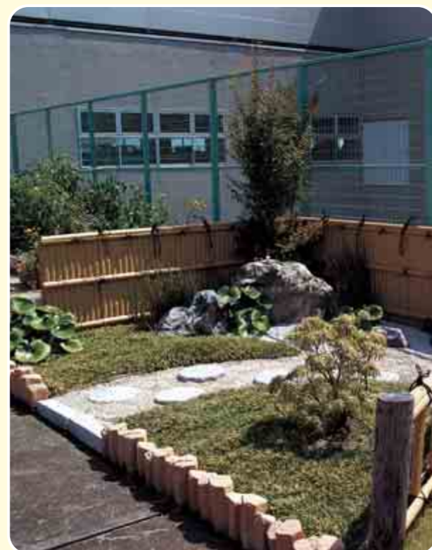
屋上緑化実験・見本園