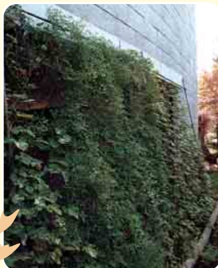
壁面緑化の例 市立相模原麻溝公園管理事務所